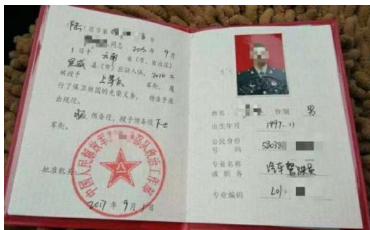
退出现役证书（2021年及以前）