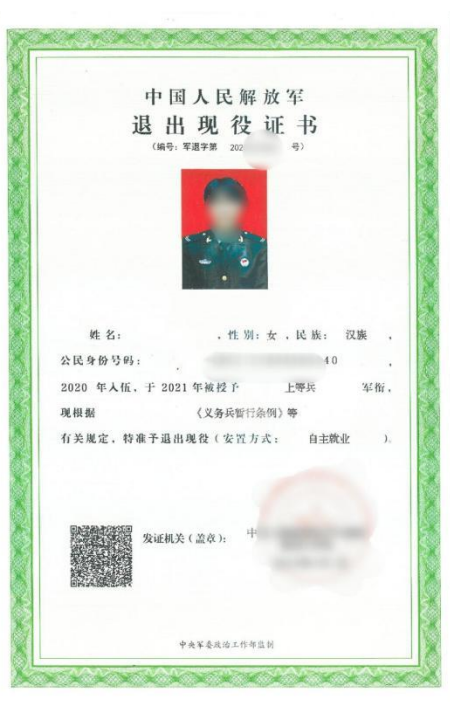
退出现役证书（2022年新版）

8、在校研究生考生和已在校攻读第二学位的本科生报考还应上传所在培养单位同意报考并加盖公章的书面证明材料。