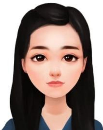
(证件照标准示例照片)